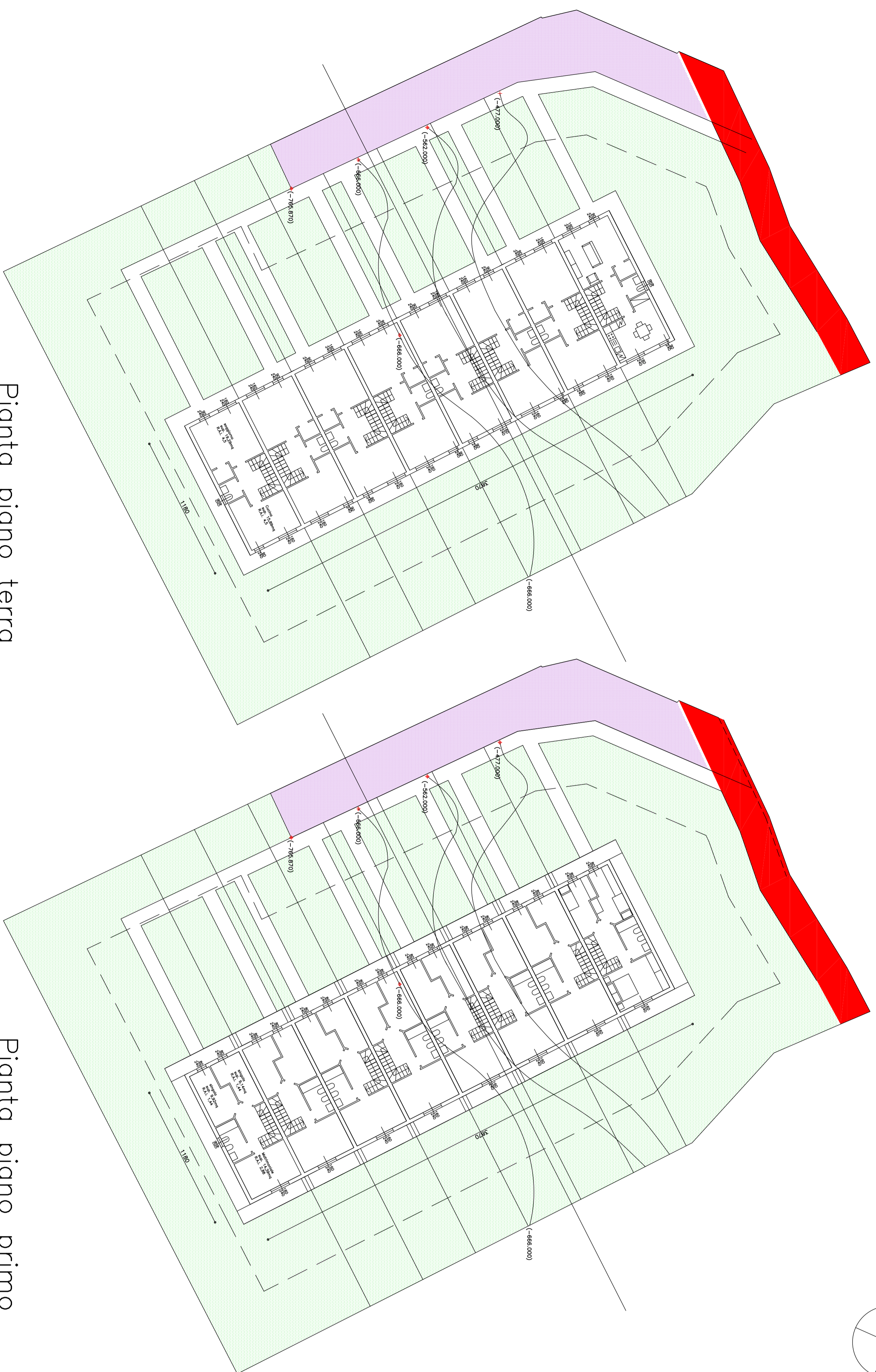
Pianta piano terra